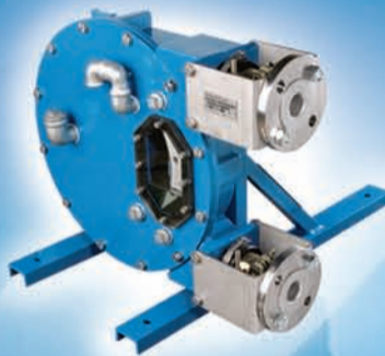
Bomba Peristáltica de Manguera