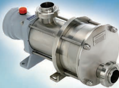
Bomba de Disco Excéntrico