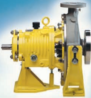
Bomba Centrífuga System One®