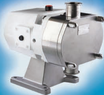
Bomba de Lóbulos