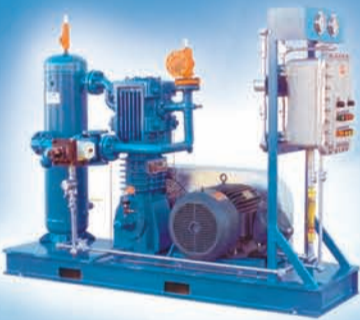
Compresores de Gas Reciprocantes