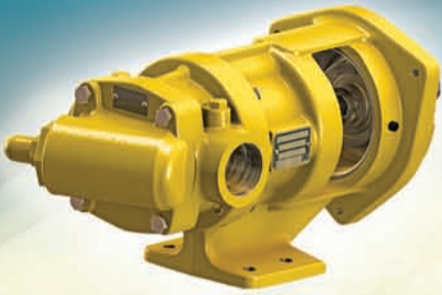
ProVane® Bomba de Paletas a Velocidad de Motor