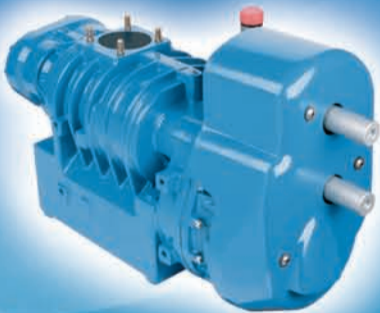
Compresores de Tornillo